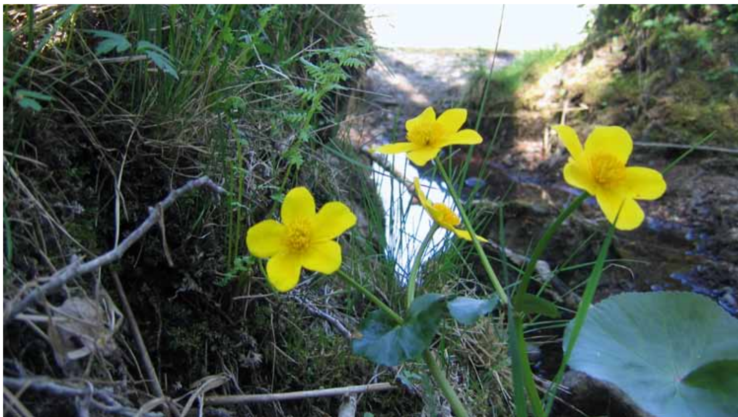
Kabbelekan är vanlig vid vatten.