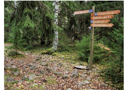
Klappersten i stigen

En relativt lättgången stig med inslag av storblockig och kuperad terräng. Du passerar den lilla vattensamlingen Galtapussen med vindskydd och grillplats. I stigen ser du här spår efter den forna strandlinjen i form av rundslipade stenar. Vid Södra utsikten (ca. 135 meter över havet) har du god utsikt över Närke-slätten, ända bort till Frövifors! Vid Yoldiaområdet sluter sig skogen tätare kring stora bergsbranter. Hittar du in i Bergakungens sal? I norr löper stigen genom öppna hållmarker med flera riktigt gamla tallar och tydliga förkastningsbranter. På din väg till och från entrén passerar du även Lilla rundan (se ovan).