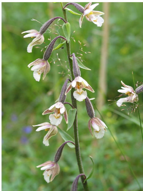
Kärrknipprot har sin rikligaste förekomst i länet i Lejakärret.